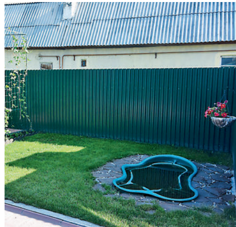
● На участке нашлось место даже маленькому водоёму

Вместе с мужем с 1997 года начали строительство дома и с этого же года стали благоустраивать территорию. Когда не стало мужа, начал помогать сын. Так и продолжаем поддерживать порядок в ограде.