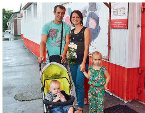
Цветы стали приятным сюрпризом в пасмурный день жителям села

Праздник 8 июля достаточно молодой, однако он прочно вошёл в сердца людей. Все любят и ждут его. В День святых Петра и Февронии все спешат признаться в любви своим близким и подарить друг другу главный символ праздника — ромашку.