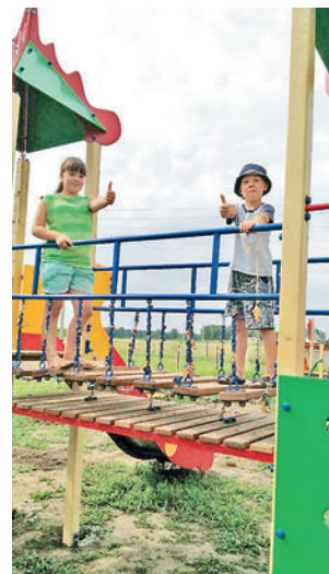
● Дети со всего посёлка уже успели оценить новое место для игр