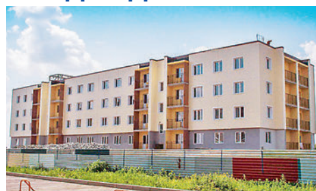
● Скоро в «Радужном» появятся новые жители

В микрорайоне «Радужный» заканчивается строительство дома №17/3.