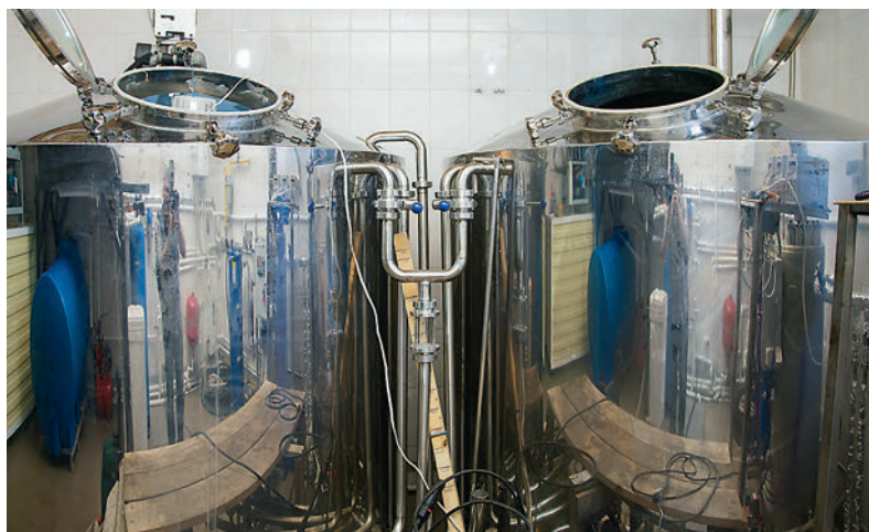
● Новый двухступенчатый варочный порядок

— Всегда хотелось что-то сделать для села, для того места, где родился и вырос, — говорит Александр. — Раньше я думал, что статус депутата — это просто формальность, но сейчас думаю иначе, хотя работаю в Совете меньше года. К примеру, мы сейчас строим детскую площадку в п.им. Крупской, совместными усилиями с администрацией, депутатским корпусом и бизнесом. Ещё хотим договориться объединить все спортивные секции, которые работают при школе №14, в один спортивный клуб. Хотим это сделать на базе школьного спортзала, в котором сейчас идёт ремонт. У нас много заслуженных тренеров при школе занимаются с детьми. И уже есть результаты. Ребята ездят на соревнования, берут первые места. В том числе и на международном уровне. Нужно поддерживать эти начинания