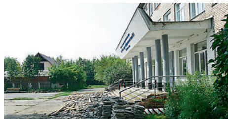
● Школа №14 с. Верх-Тула начала готовиться к новому учебному году. Прежде всего — с ремонта крыльца. В следующем номере газеты «Родные просторы» мы расскажем о всех изменениях, произошедших в школе.