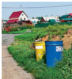
● Предполагаемый срок создания мусоросортировочного комплекса на территории сельсовета — три года

Областное правительство одобрило новую схему обращения с отходами на территории Новосибирской области. В неё входит и строительство мусоросортировочного комплекса на территории Верх-Тулинского сельсовета.