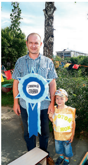
● Родители тоже принимают участие в праздниках, организованных детским садом

Жизнь дошкольников спланирована так, что каждый день неповторим, потому как наполнен интересным содержанием.