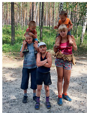
● Вместе — веселей!

— Я не могу сказать, что у нас чётко распределены роли в семье, — говорит