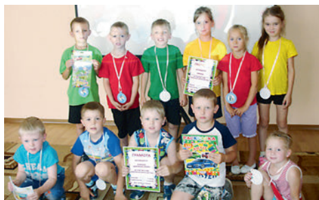
● Воспитанники детского сада «Солнышко» везде соблюдают ПДД

16 июня 2016 года по инициативе педагогов детского сада «Солнышко» были организованы «Весёлые старты», в которых участвовали дети детского сада и воспитанники летнего лагеря школы №14.