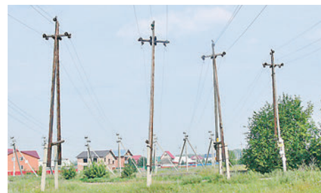
● В каждую грозу аварийная бригада РЭС может быть вызвана на отключение электричества

Для защиты электрических сетей в перечисленных случаях, а также для их защиты от грозовых перенапряжений в электрических сетях используются автоматические выключатели и разрядники. Указанное оборудование служит для ограничения зоны распространения негативных последствий, отмеченных выше. После отключения автоматического выключателя или повреждения разрядника, в результате воздействия импульса перенапряжения, оборудование вводится в работу после приезда на место повреждения персонала оперативной выездной бригады из с. Криводановка.