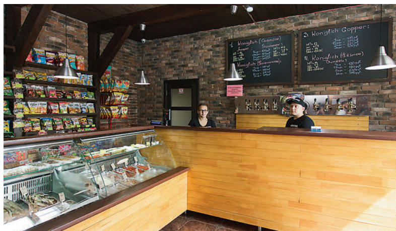
● Магазин при пивоварне по адресу: ул. Чёминский жилмассив, 1276 работает уже почти полгода

Я начал этим заниматься примерно два с половиной года назад. Варил дома, в кастрюлях. Потом начал общаться, набираться опыта, знакомиться с людьми, потихоньку участвовать в пивных фестивалях