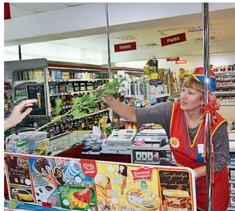
Участники студии дарили цветы работникам магазинов и встречным жителям села

8 июля Россия отмечала День семьи, любви и верности.