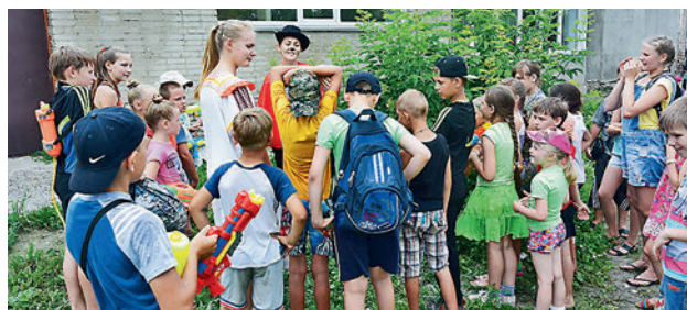
От желающих найти цветок папоротника не было отбоя

Теперь модное течение «квест» дошло и до Верх-Тулы. Молодёжный совет села и Музыкально-эстетический центр провели захватывающие квесты, посвящённые празднику Ивана Купала. Как подростки, так и молодёжь два дня подряд проходили