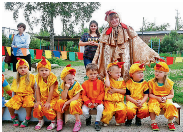
● Даже летом ребята не остаются без занятий

Жизнь детей в нашем детском саду «Золотой ключик» летом наполнена праздниками, развлечениями, играми, смехом и весельем